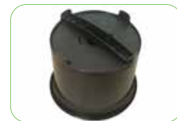
Cyclonafscheider code: 3.8023.109057