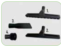
1. Vloerzuigmond voor droogzuigen code: 3.8023.109071 2. Vloerzuigmond t.b.v. waterzuigen code: 3.8023.109070 3. Kierenzuigmond code: 3.8023.102016 4. Borstelzuigmond rond code: 3.8023.102017