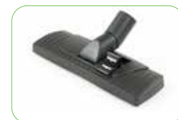
Combitool P30 WD / P30 WDS