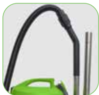
2,2 m flexibele zuigslang met handvat code: 3.8023.109069 2 RVS zuigbuizen (0,5 m) code: 3.8023.102018